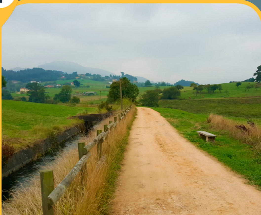
CANAL DEL RÍO NARCEA