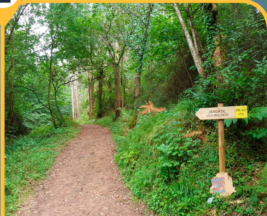
RUTA DE LOS MOLINOS