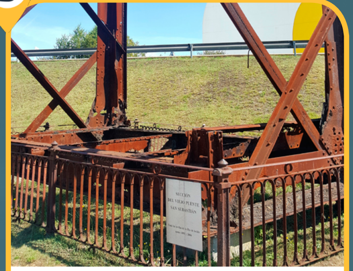
ANTIGUO PUENTE S.SEBASTIÁN