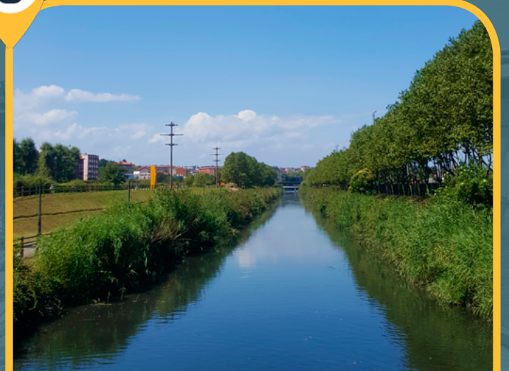
RÍA DE AVILÉS