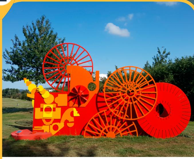
PASEO DEL ACERO