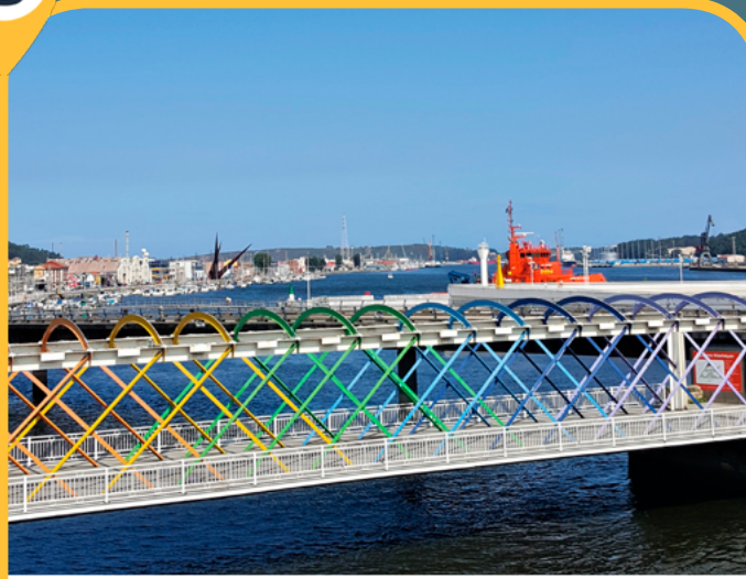
PUENTE SAN SEBASTIÁN