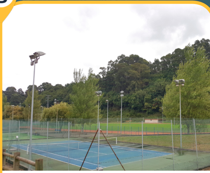
COMPLEJO DEPORTIVO LA TOBA