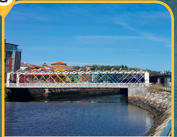
PUENTE SAN SEBASTIÁN