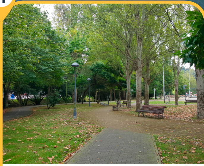
PARQUE DE LA TOBA