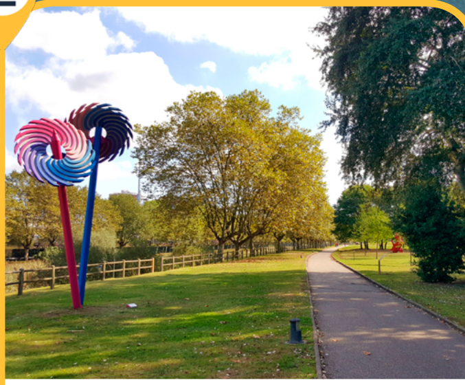
PASEO DE LA RÍA DE AVILÉS