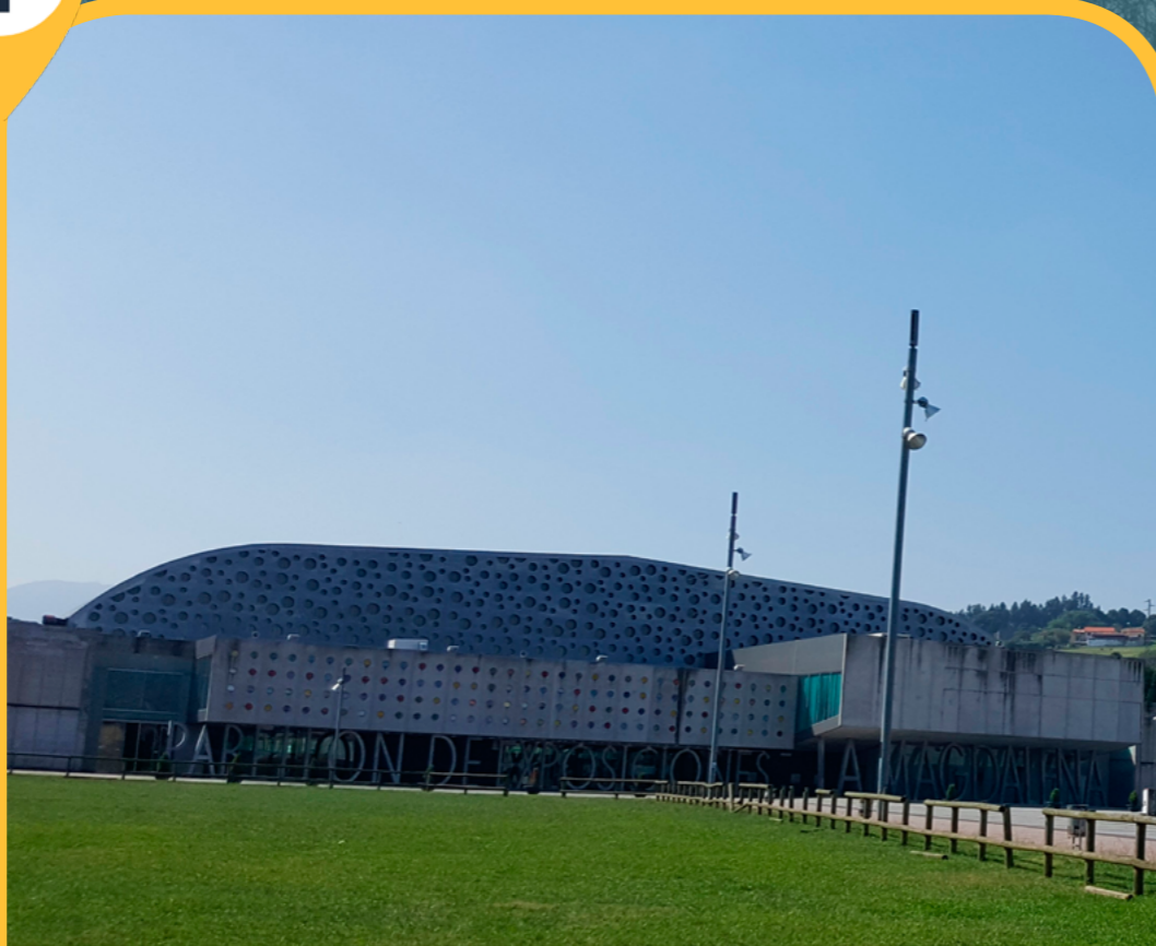
PABELLÓN DE EXPOSICIONES