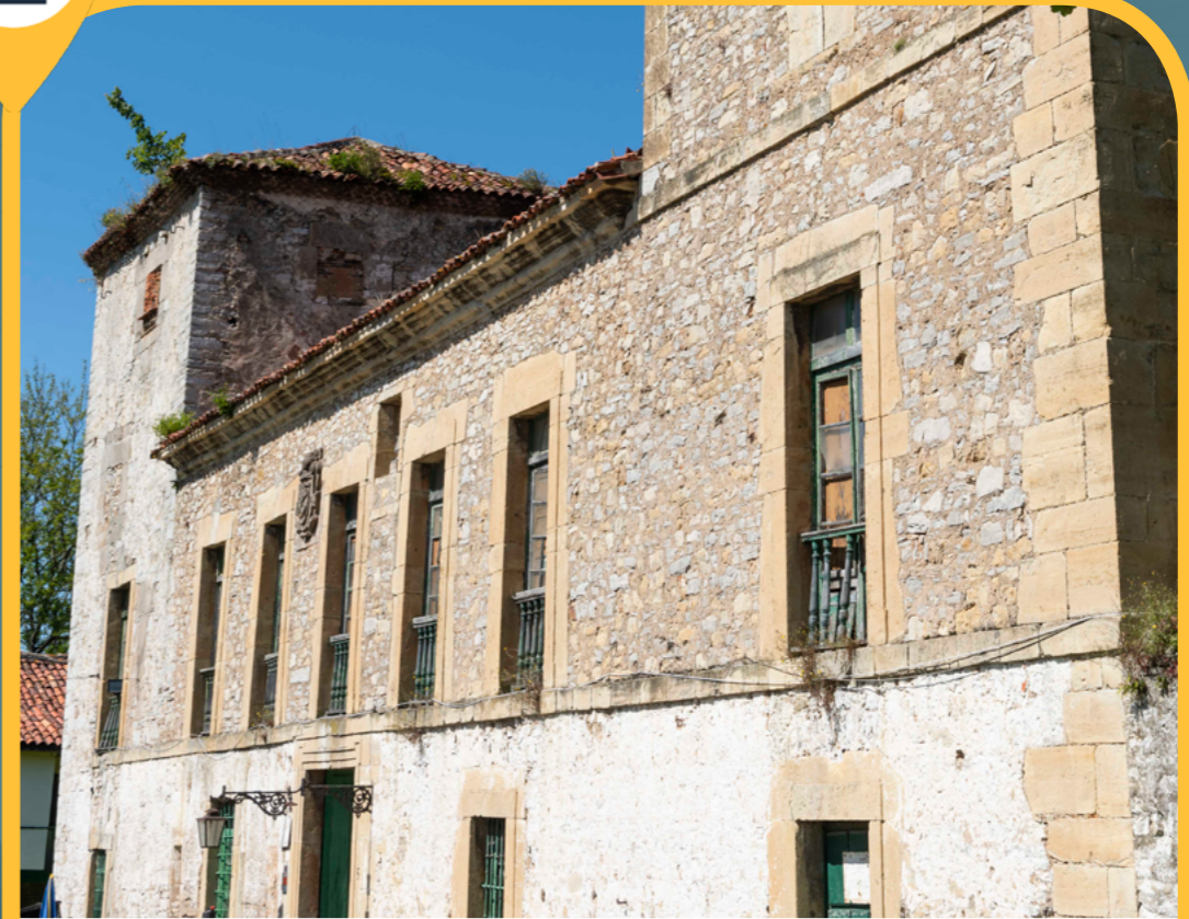
PALACIO DE LOS RODRÍGUEZ DE LEÓN